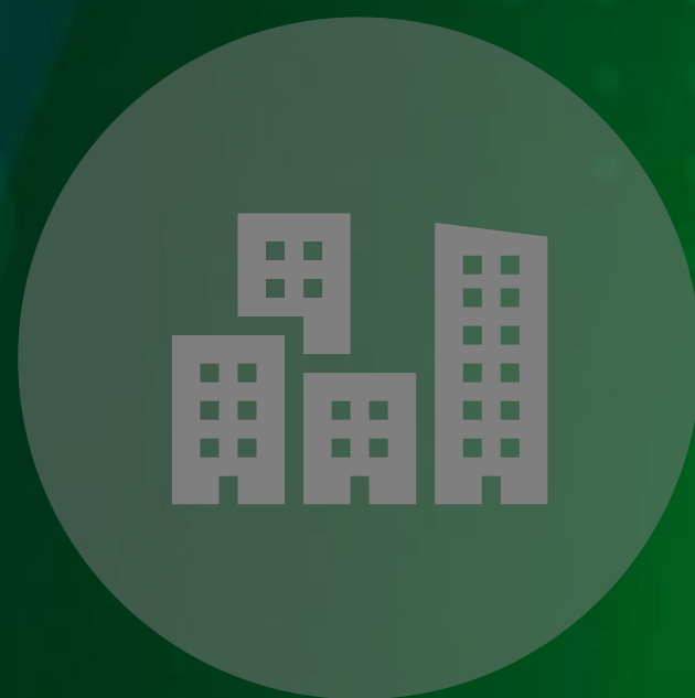
Auxílio Inclusão Produtiva Urbana