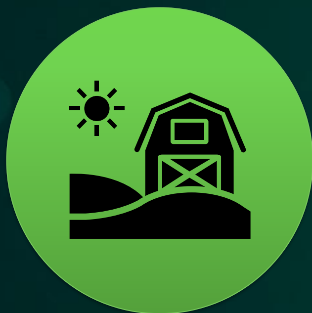
Auxílio Inclusão Produtiva Rural